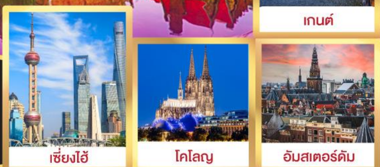
เชียงใหม่