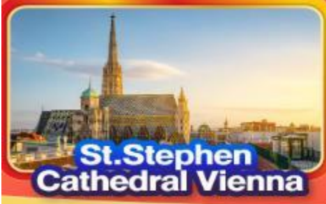
St. Stephen Cathedral Vienna