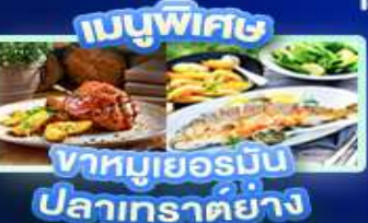
เมนูพิเศษ ข่าหมูเยอรมัน ปลาเกราด์ย่าง

เวียนนา ปราสาทนอยชวาสไตน์ ลูเซิร์น เซอร์แมท ชุก ซูริก