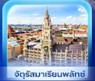
จัตุรัสมาเรียนพลาทซ์

เวียนนา ปราสาทนอยชวาสไตน์ ลูเซิร์น เซอร์แมท ชุก ซูริก