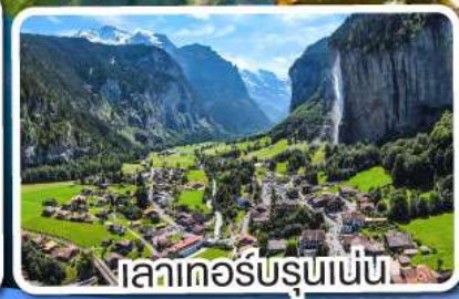
เลาเคอร์บรุนเนน