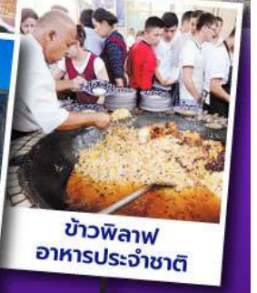
ข้าวพิลอฟ อาหารประจำชาติ