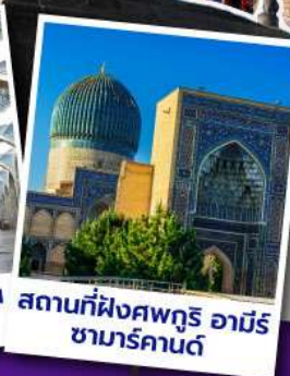
สถานที่ฝังศพกูรี อามิร ซามาร์คานด์