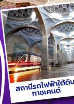
สถานีรถไฟใต้ดิน ทาชเคนต์